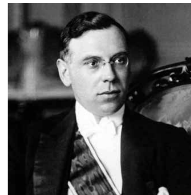
Zigfrīds Anna Meierovics

"1917. gadā Rīgā vēl nenoteikti runāja tikai par autonomiju. Neatkarīgās Latvijas zvaigzne uzlēca Valkā, kur vēlā rudenī sanāca Latviešu Nacionālā padome, lai izteiktu protestu pret Kurzemes pievienošanu Vācijai un pasludinātu, ka Vidzeme, Kurzeme un Latgale ir nedalāmas, neatkarīgas valsts vienība, kuras iekārtu noteiks Latvijas Satversmes sapulce. Tā bija pirmā Latvijas pasludināšana," 1920. gadā piezīmēs ar nosaukumu "Latvijas iecerēšana" rakstīja Kārlis Skalbe 1 .