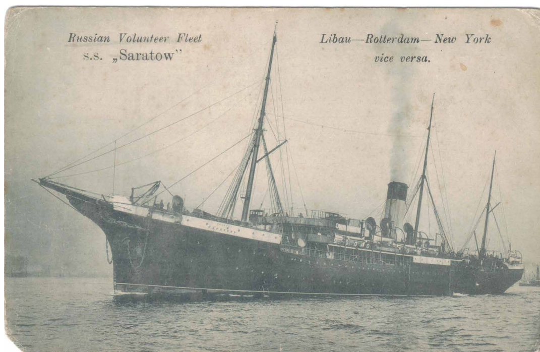
Liepāja. Kuģis "Saratov", (191-).

K. Ulmaņa Pagaidu valdības uzsākto pirmo valsts iestāžu radīšanu pārtrauca Sarkanās armijas (lielinieku) iebrukums Latvijā 1918. gada beigās. Jau 1919. gada 3. janvārī lielinieki sagrāba Rīgu, un Latvijas Pagaidu valdība bija spiesta doties uz Jelgavu un dažas dienas vēlāk uz Liepāju. Otru triecienu deva vācieši, 1919. gada 16. aprīlī izdarot valsts apvērsumu, tā dēvēto “Liepājas” jeb “aprīļa” puču. Tā rezultātā Liepājā izveidojās vāciešiem padevīgā Andrieva Niedras (1871-1942) valdība, bet K. Ulmaņa valdības ministrijas atkal bija spiestas pārtraukt darbu, un valdības locekļi meklēja patvērumu uz tvaikoņa “Saratov” Liepājas reidā. Latvijas teritorija bija sarukusi līdz prāva tirdzniecības kuģa klājam un dažiem igauņu armijas (Igaunijas un Latvijas valdības bija noslēgušas savstarpēju militārās sadarbības līgumu cīņai pret lieliniekiem) atbrīvotajiem pagastiem Ziemeļvidzemē.