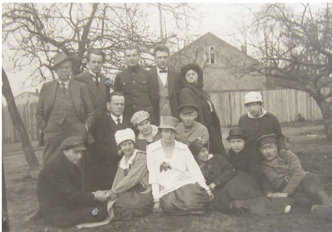
Valka. Pagaidu Nacionālā teātra ansamblis, (1918. gada maijs).

Pēc Cēsu kaujām un Pagaidu valdības atgriešanās Rīgā 1919. gada jūlija sākumā valsts dibinātāji jau trešo reizi ķērās klāt svarīgāko institūciju veidošanai. Viņi uzskatīja, ka kultūras iestāžu radīšana ir tikpat svarīga kā bruņoto spēku un valsts pārvaldes organizēšana. Priekšstats par latviešiem kā kultūras nāciju un Latvijas valsts virsuzdevumu – kultūras saglabāšanu un attīstīšanu – rada papildījumu jau 1919. gada jūlijā – septembrī, kad tika dibināts Latvijas Mākslas muzejs, Valsts bibliotēka, Nacionālā opera un Nacionālais teātris, Vēsturiskais arhīvs u.c.