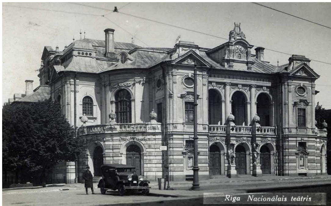
Rīga. Nacionālais teātris, (193-).

Uzsāktais darbs jau atkal bija jāaptur rudenī, jo Rīgai uzbruka jauns ienaidnieks – Pāvella Bermona-Avalova (1877–1973) vadītā armija. Latvijas Konservatorija apturēja divas dienas iepriekš uzsākto audzēkņu uzņemšanu. Nacionālās operas namu trāpīja astoņi ienaidnieka lielgabalu raidīti lādiņi. Tikko atklātās Latvijas Augstskolas soli jau atkal stāvēja tukši – daudzi studenti un mācībspēki bija ņēmuši rokās ieročus, lai dotos aizstāvēt galvaspilsētu no kārtējā uzbrukuma.