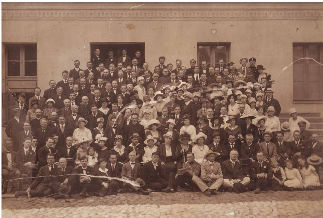
Latvijas Nacionālās operas kolektīvs pie operas nama, (1919. gada septembris). Attēls no Latvijas Nacionālās digitālās bibliotēkas kolekcijas Zudusi Latvija .

No Alfrēda Ozoliņa atklāšanas izrādei veltītās recenzijas: "Korekti dzied koris. Ansambli apmierinoša noteiktība. Orķestrs, izņemot koka pūtējus, starp kuriem atkal liela tieksme uz nesaskanību, un dažām pavisam pārsteidzošām nejausībām arfas partijā, kura atrodas spējīga un pazīstama mūziķa rokās, godam "spēlēja" savu vadošo lomu, par ko jāpateicas diriģentam Teodoram Reiteram, kuram vispār pie izrādes panākumiem piekrīt lauvas tiesa." (Latvijas Sargs, 1919. gada 4. decembris)