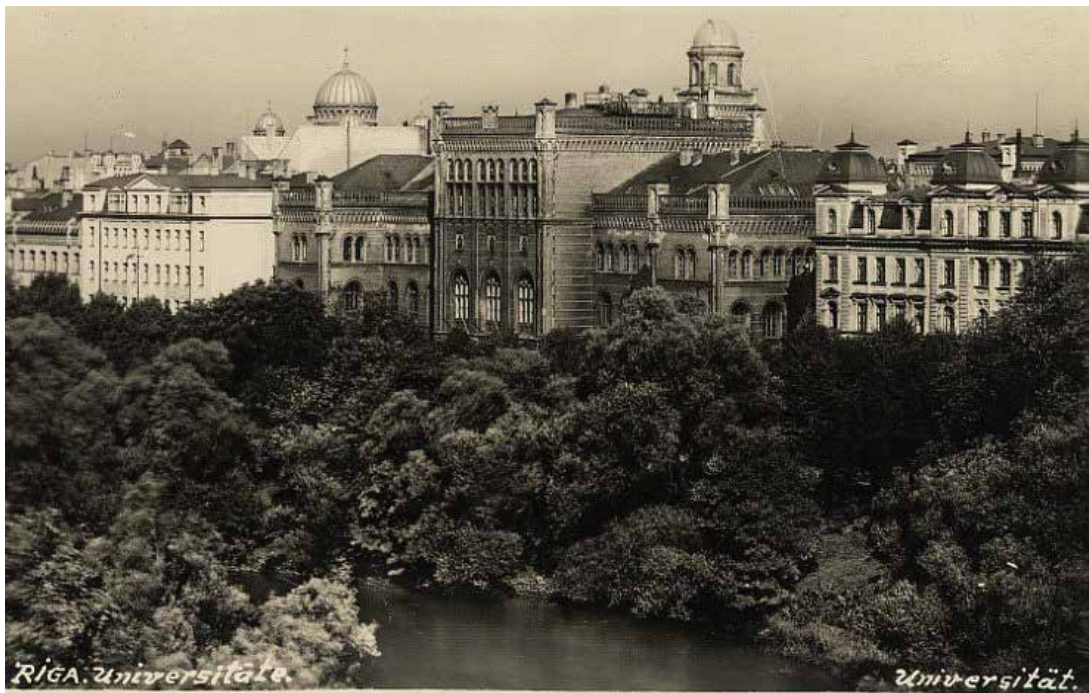
Rīga. Latvijas Universitāte, (192-).

jaunās Latvijas valsts ambīcijas bija daudz lielākas – tā vēlējās radīt pilnvērtīgu nacionālo universitāti nevis atjaunot krievu vai vācu laika augstskolu. Tās izveidošanai tika izveidota speciāla Organizācijas komisija, kas pāris mēnešu laikā paveica milzu darbu, pārņemot Baltijas Tehnisko augstskolu, izveidojot Latvijas Augstskolu un sagatavojoties pirmā mācību gada uzsākšanai.