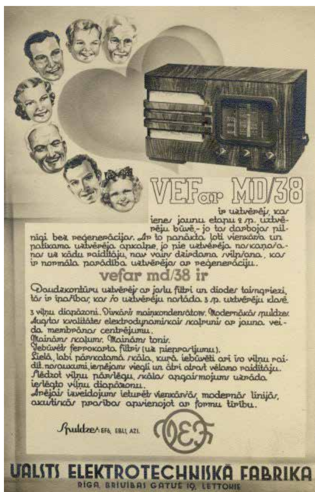
VEF produkta "Vefar MD/38" reklāma, (193-).