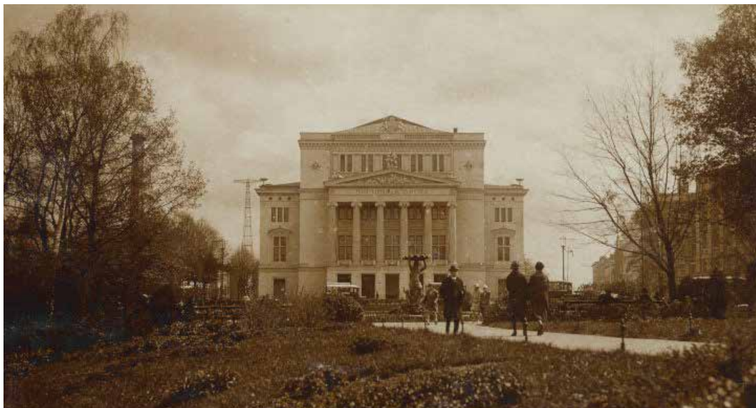
Rīga. Latvijas Nacionālā opera, (193-).